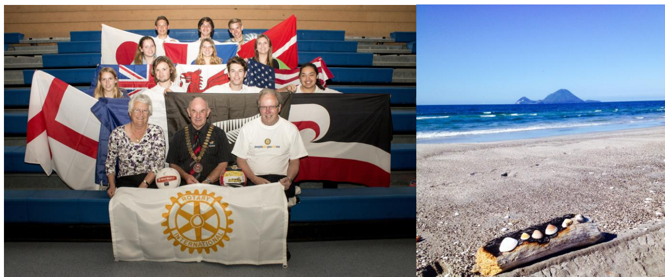
Voici l'équipe de netball presque au complet avec l'entraîneur à gauche et le président du rotary au centre !